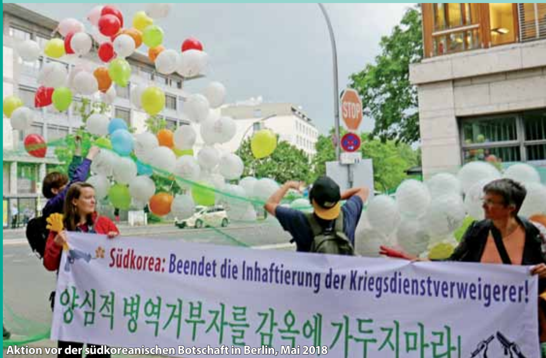
Aktion vor der südkoreanischen Botschaft in Berlin, Mai 2018